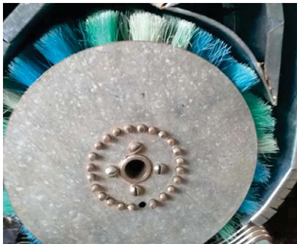
Рисунок 1 – Лопатевий ротор відцентрового прямоточного сепаратора зерна

На кафедрі сільськогосподарського машинобудування Центральноукраїнського національного технічного університету було створено оригінальну конструкцію відцентрового прямоточного сепаратора зерна [13-15], яка дозволяє здійснювати пневморешітне очищення зерна і має високі показники технологічної ефективності. Основою створеної конструкції є багатофункціональний робочий орган – лопатевий ротор (рис.1), який одночасно виконує кілька операцій. Він створює повітряний потік який використовується для пневмосепарації, прискорює зерно, переміщуючи його по решету, очищує робочі канали останнього і сприяє виведенню сходової фракції з машини.